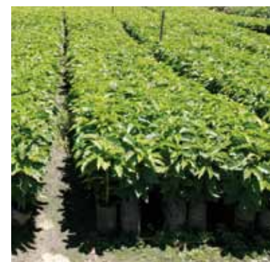
Pépinière de caféiers