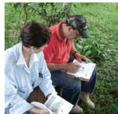
TASQ™ : une formation personnalisée