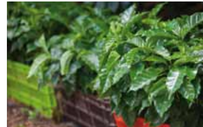
Plantules, Caldas, Colombie