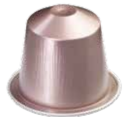
Rosabaya : le premier Grand Cru Pure Origine Nespresso 100 %