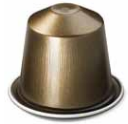
Dhjana : la première Edition Limitée Nespresso 100 % AAA