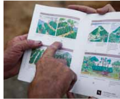
Programme de formations pour les fermiers basé sur le TASQ™