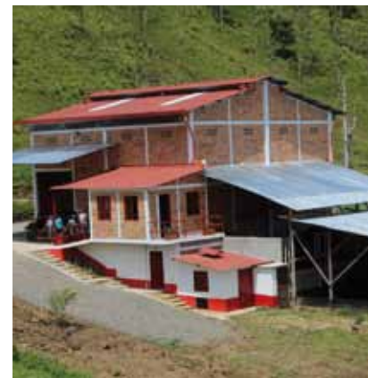
Centre de traitement communautaire de Jardín en Colombie