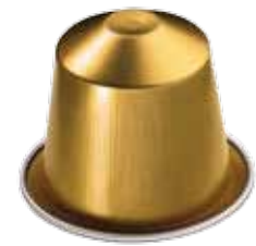
Volluto : le premier Grand Cru Nespresso 100 % AAA