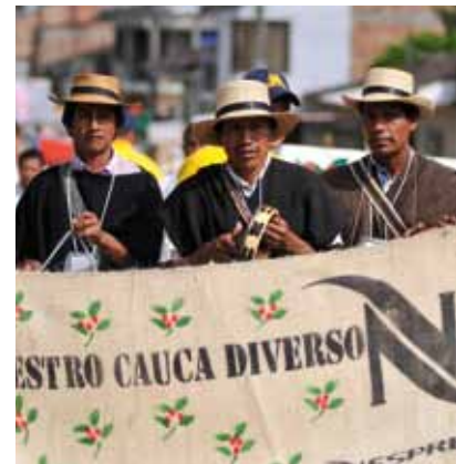
Célébration à Popayán