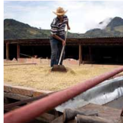
Séchage au soleil